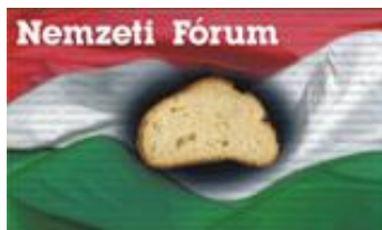
Bács-Kiskun Megyei Szervezete